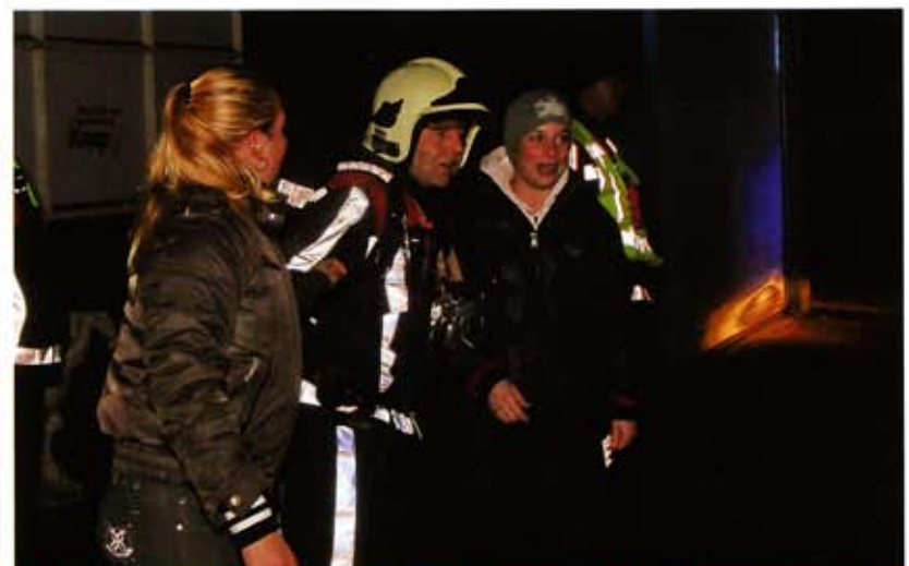
DE MEDEWERKSTERS MAKEN HET DE BEVELUOERDER KNAP LASTIG