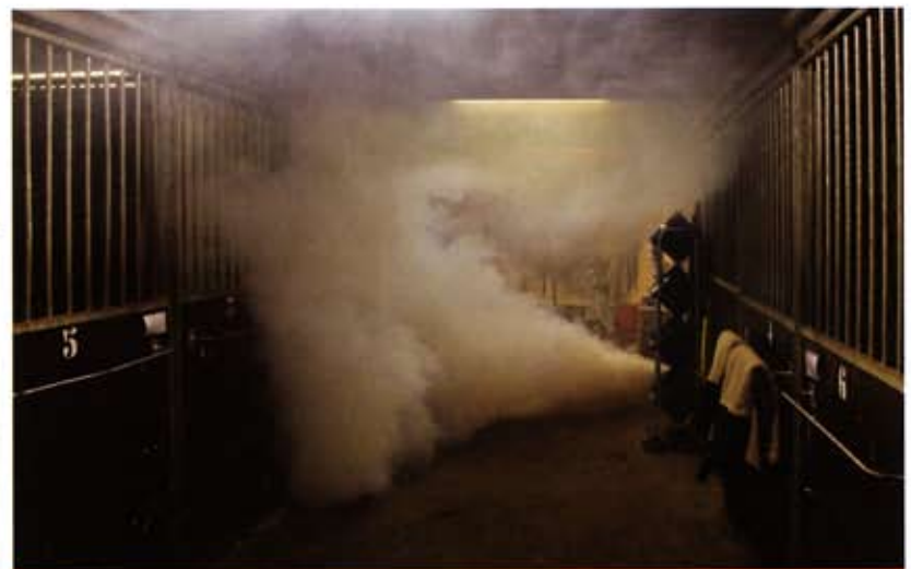
MEN IS NIET ZUINIG MET ROOK.

een kleine shovel geparkeerd en uitgerekend tussen het stro vliegt deze in brand. Er is een doorslag naar de stal die vol met rook komt te hangen. Stalmedewerker Piet heeft geprobeerd de paarden te redden maar is bevangen door de rook en in het gangpad in elkaar gezakt." Vader en zoon Kwakernaat zijn niet zuinig met rook en al snel staat niet alleen de stal vol met rook, maar komt deze ook aan alle kanten naar buiten rollen. De tien paarden in de stal hebben er overigens weinig last van. Harko: "Paarden